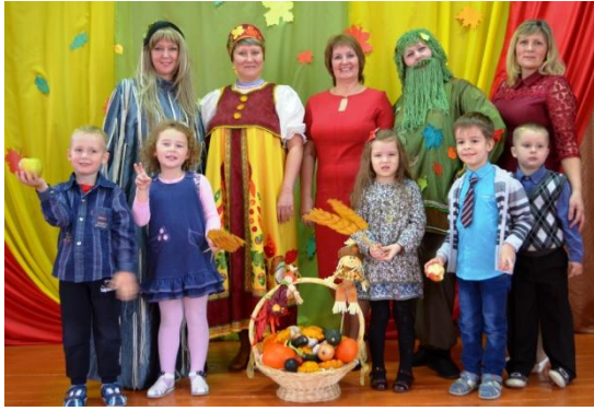
Тематический праздник «Здравствуй, осень»

Дети с удовольствием посещают музеи, выставки.