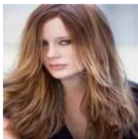
Модель женской асимметричной стрижки