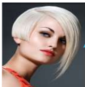
Модель женской стрижки «Каре»